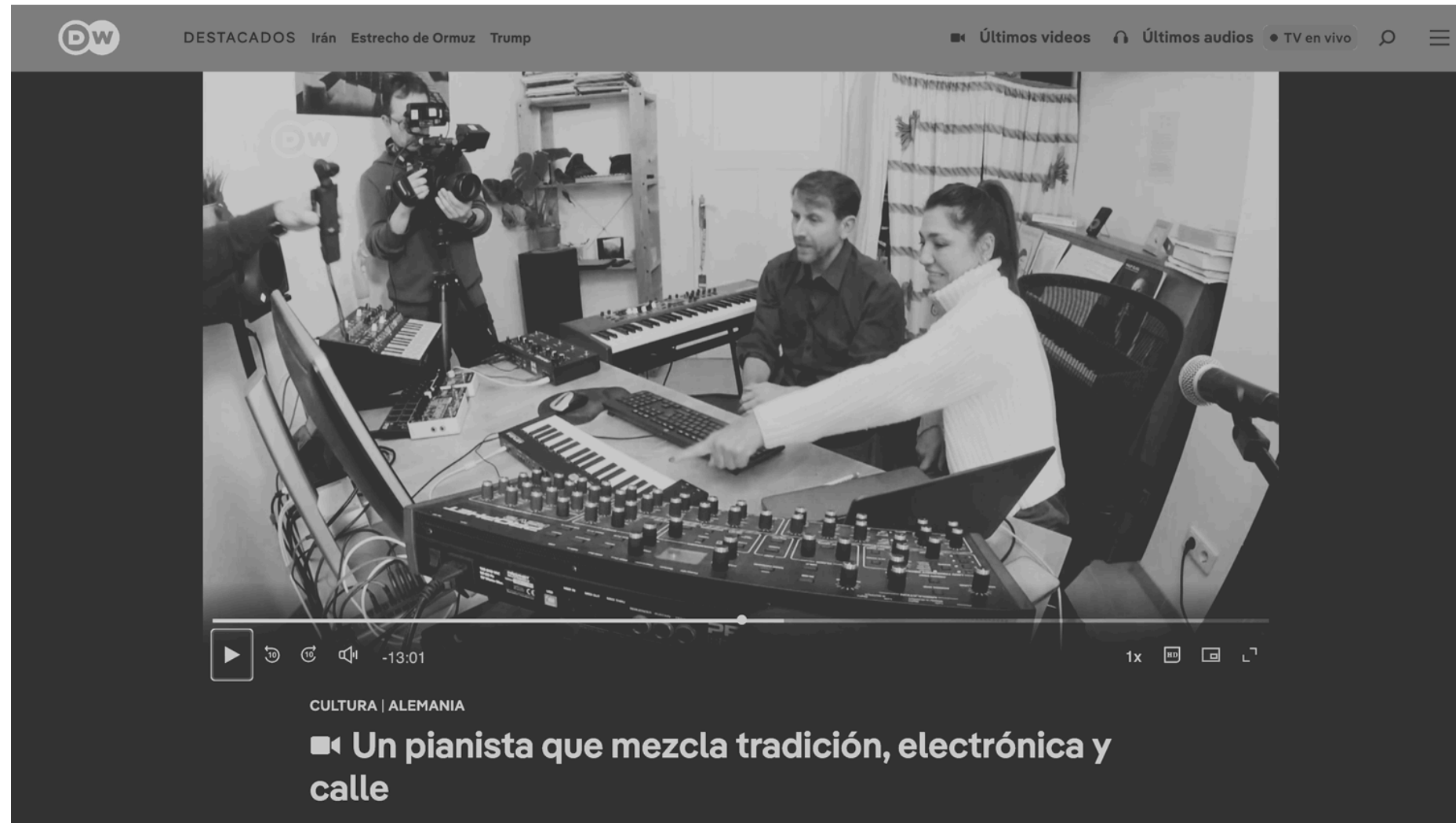
Deutsche Welle, 2026